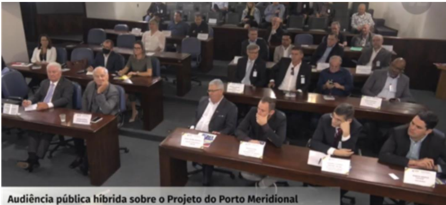
Audiência pública híbrida sobre o Projeto do Porto Meridional